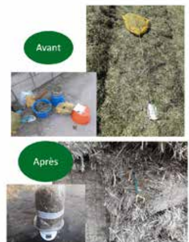
Figure 2 : Méthode des sacs enfouis