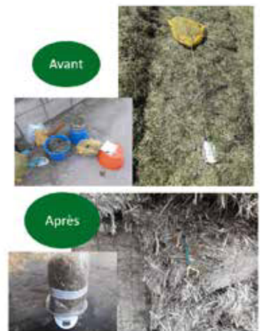
Figure 2 : Méthode des sacs enfouis