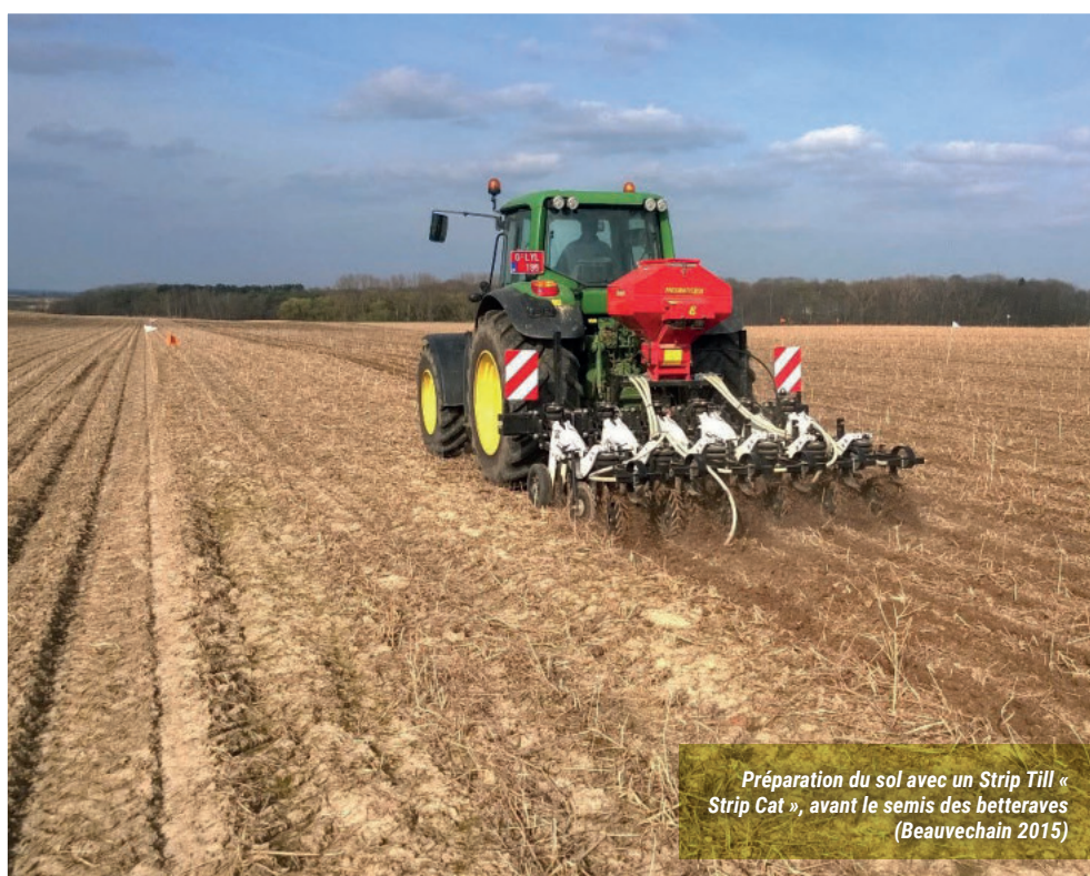
Préparation du sol avec un Strip Till « Strip Cat », avant le semis des betteraves (Beauvechain 2015)

Si le matériel est disponible dans votre région, le strip-till est un bon compro-