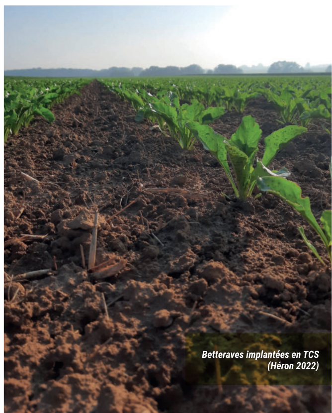
Betteraves implantées en TCS (Héron 2022)

Les betteraves ont besoin d'une structure meuble, aérée et homogène pour développer pleinement leur pivot et leur potentiel de rendement. Cette structure favorable est classiquement obtenue par un travail profond du sol mais peut aussi être le résultat de processus naturels (activité biologique : colonisation racinaire, activité des organismes du sol, ...). Cette structure naturelle va être beau-